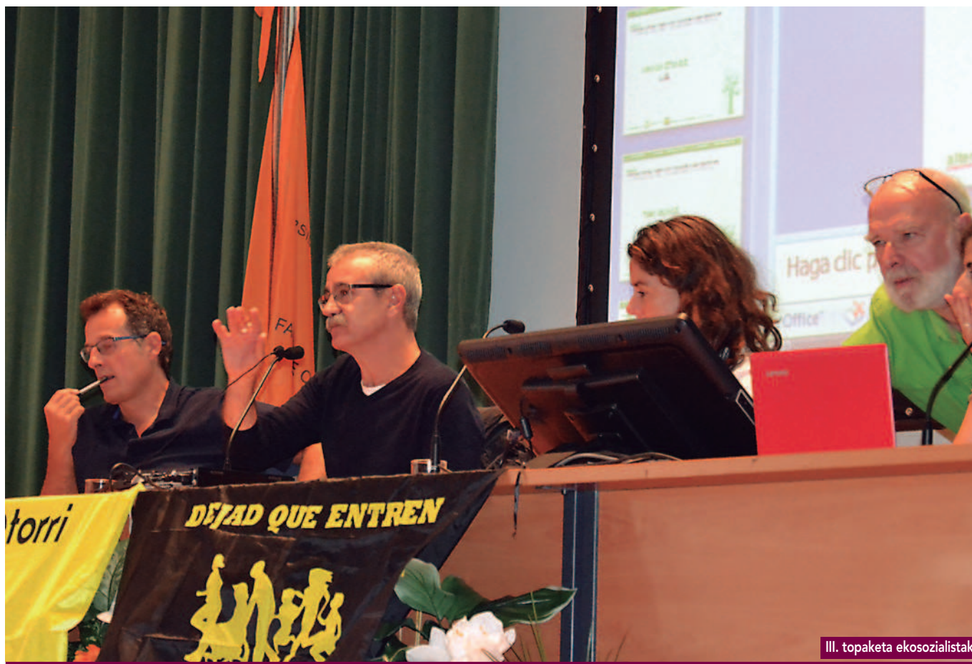
III. topaketa ekosozialistak

construye el poder de las grandes corporaciones transnacionales es el capitalismo. Ambas categorías son inseparables -capitalismo y empresas transnacionales- y se sustentan en la acumulación de riqueza -sin límites y en muy corto espacio tiempo- de unos pocos a costa de los derechos de las mayorías sociales, de los derechos de los pueblos y de la naturaleza. Los derechos humanos y el medio ambiente se convierten en meros recursos al servicio de la acumulación de capital.