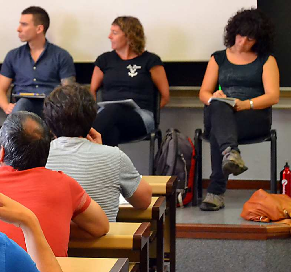
III. topaketa ekosozialistak

zida eta iraunkortasunaren kontrakoa dela ulertzea da; kapitala ezaugarritzen duen diru gosea neurrigabea da, baliabide naturalak ez bezala. Azken batez, baliabide naturalen aferak sortzen duen gatazkari ekin behar dio langile klaseak, garapena oso ezberdina izango baita, baldin eta baliabide hauek kapitalaren esku edo herrien esku badaude.