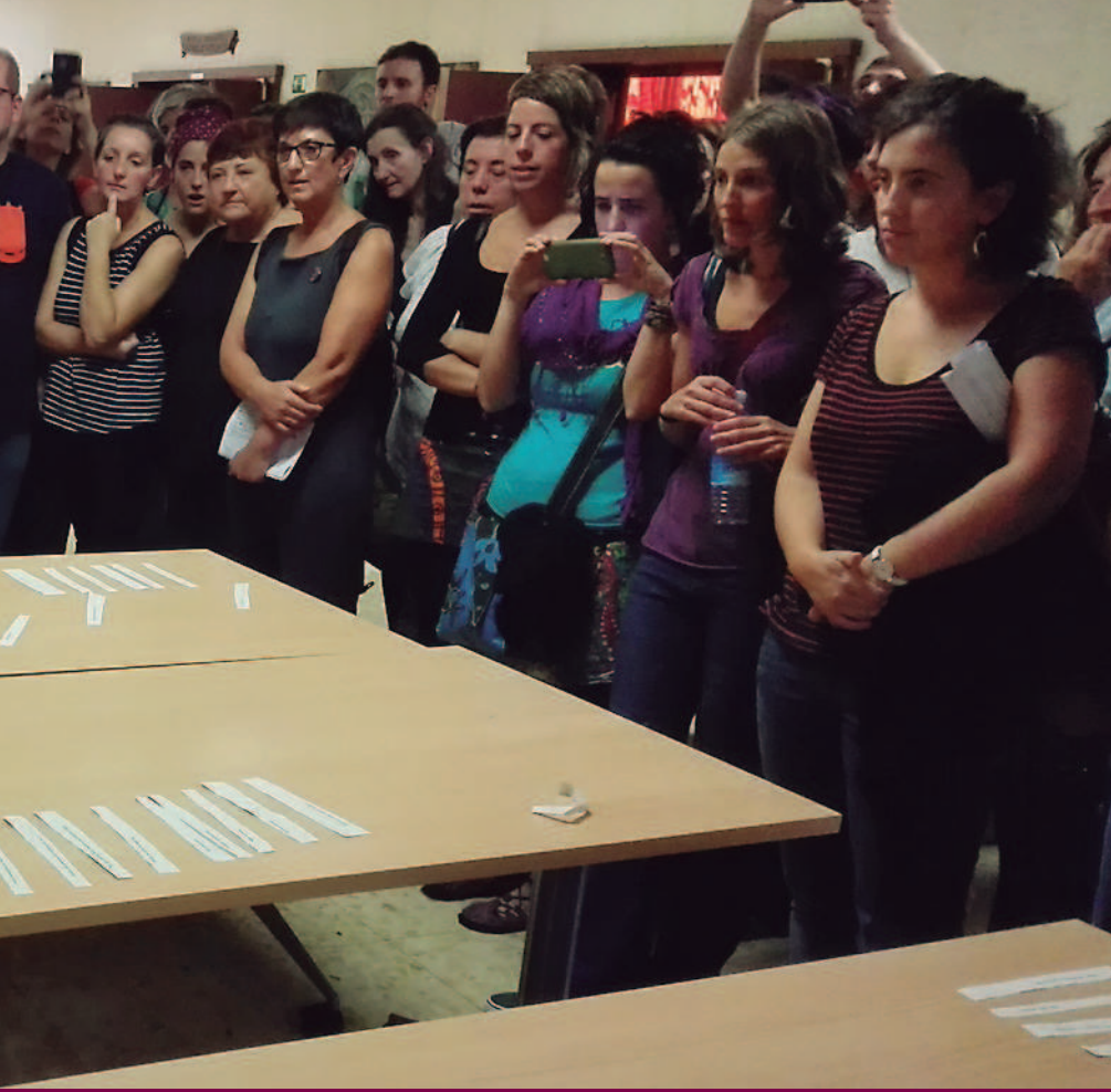
III. topaketa ekosozialistak

mundo rico. Y, aparecen, todas las dinámicas de desempleo galopante, de exclusión o el proceso de empleados y empleadas pobres. Porque ya, las propias condiciones laborales son generadoras de pobreza. El trabajo deja de cumplir la función social de librarte de la pobreza, y, la función también económica de salvarte de la precariedad. Esta situación nos la estamos encontrando desde hace tiempo.