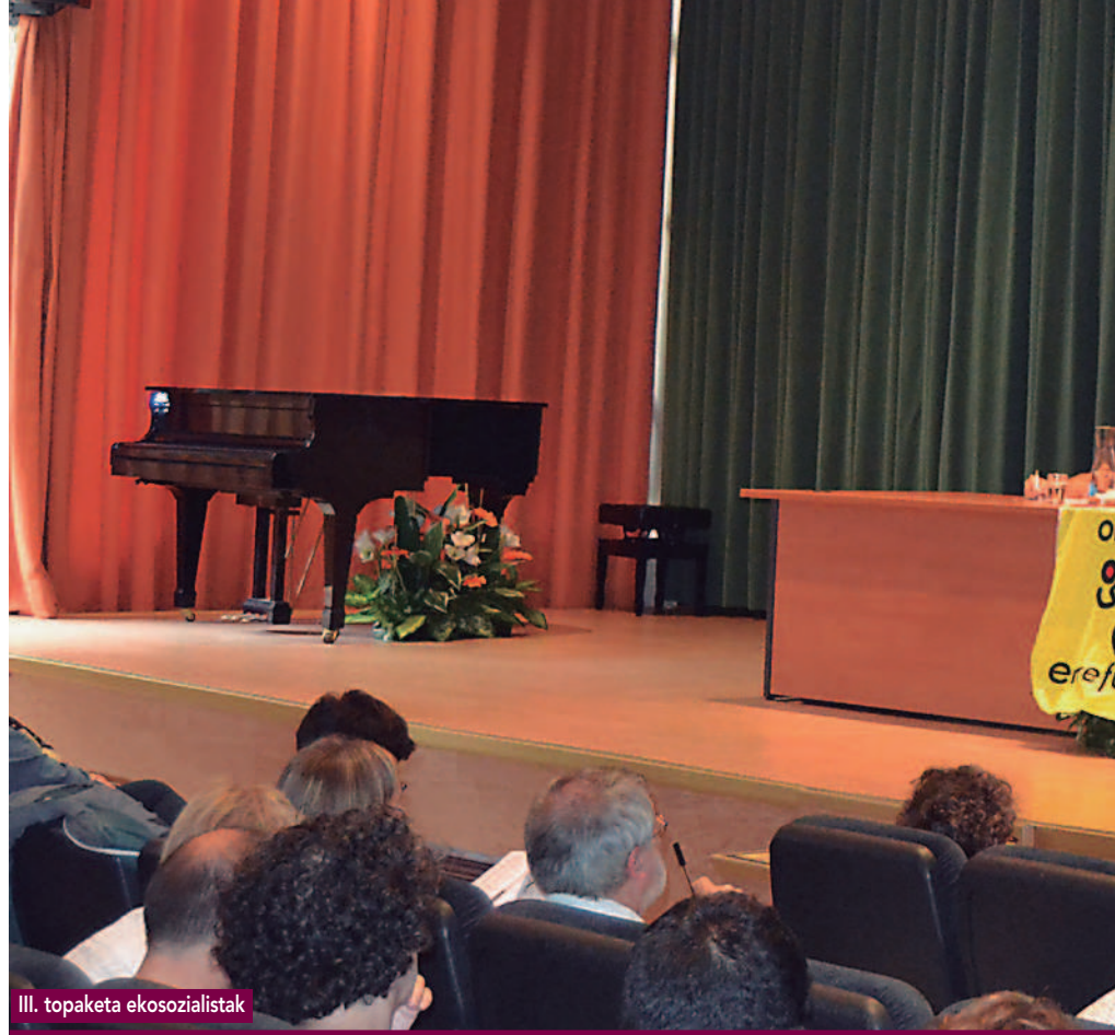
III. topaketa ekosozialistak

Hor egon daitezke zenbait aukera teorikoa biopolitikaren euskal eremua