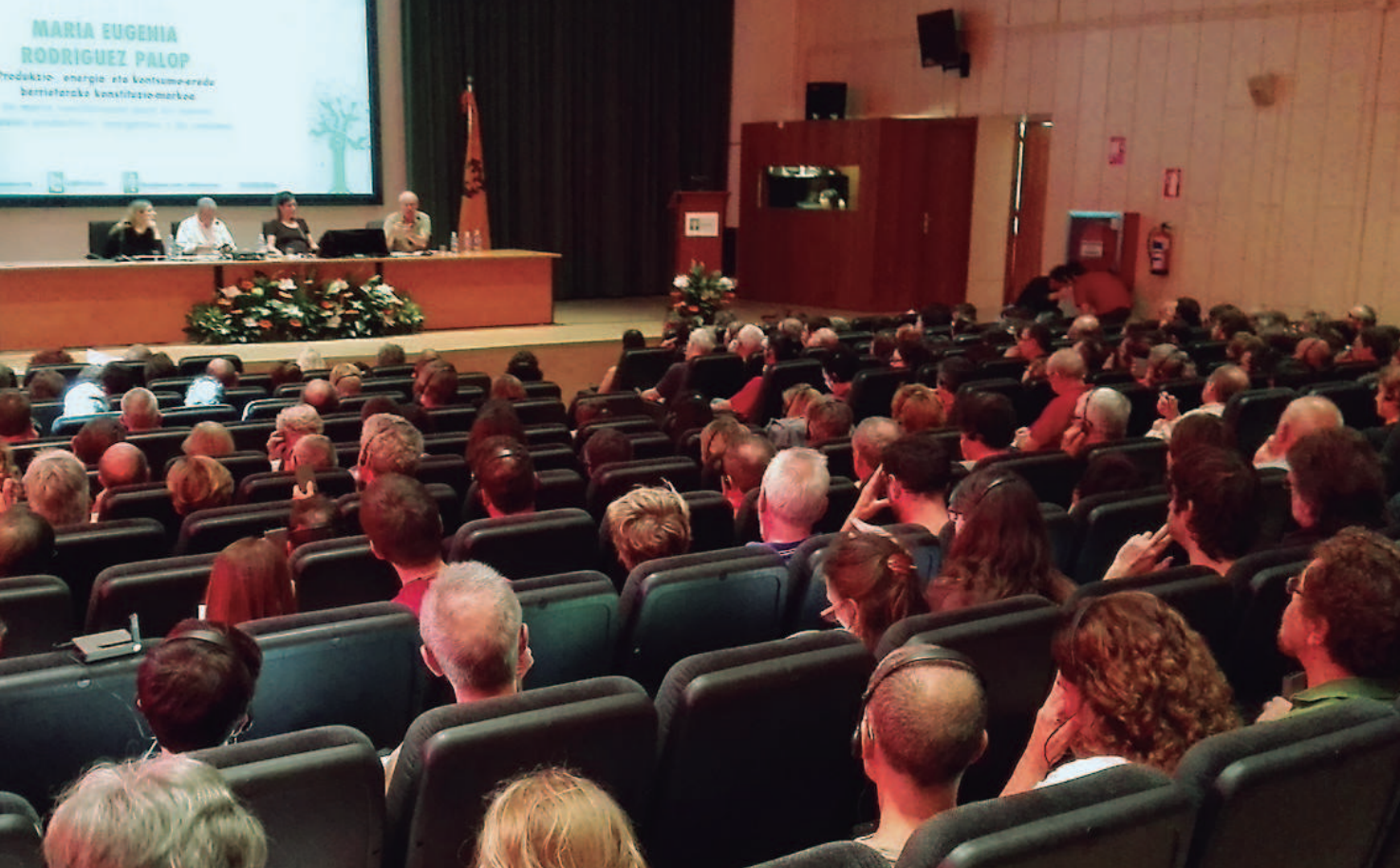
III. topaketa ekosozialistak